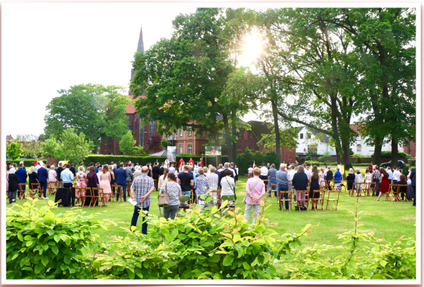
„Open-Air-Gottesdienst im Vitus-Park, hinter der Kirche.